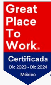
GREAT PLACE TO WORK 2023 - 2024