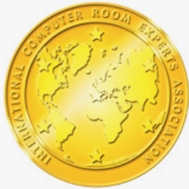
ICREA NIVEL IV

En Mainbit contamos con las siguientes certificaciones y reconocimientos empresariales que nos hacen ser competitivos en los diferentes rubros de la industria.