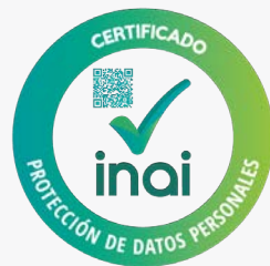
INAI PROTECCIÓN DE DATOS PERSONALES