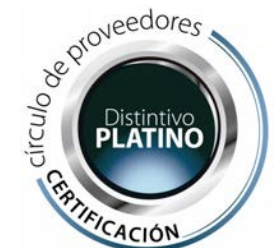
CÍRCULO DE PROVEEDORES DISTINTIVO PLATINO